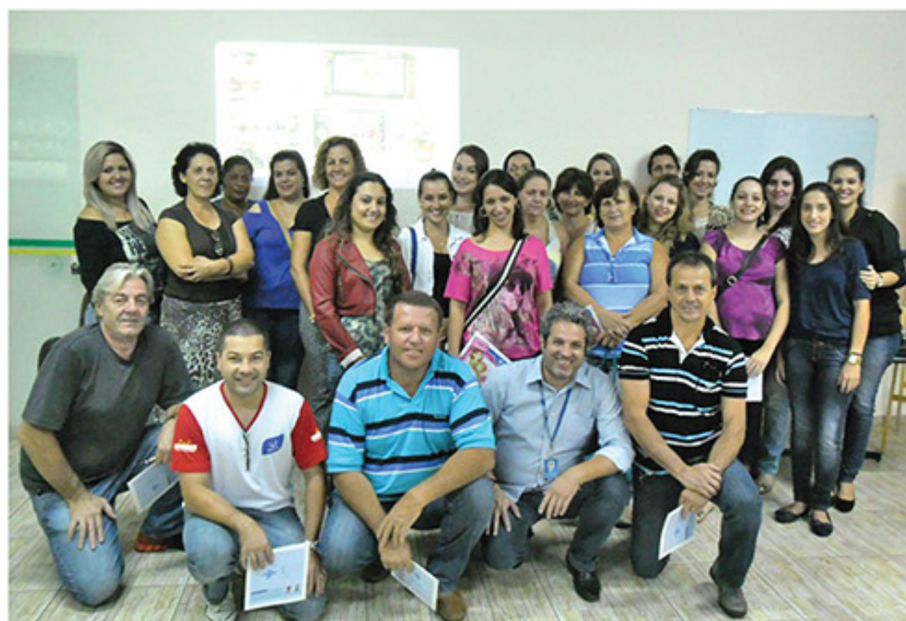
Grupo de empresários e funcionários que participaram da palestra

Para mais informações sobre o assunto podem ser obtidas no Posto SEBRAE de Atendimento ao Empreendedor ou pelo telefone (19) 3594-1109.