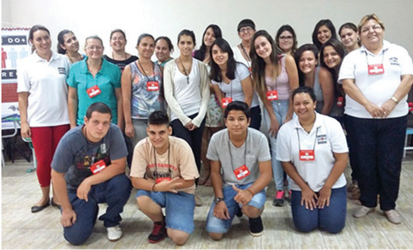
Equipe Aprendiz, "time" da tarde