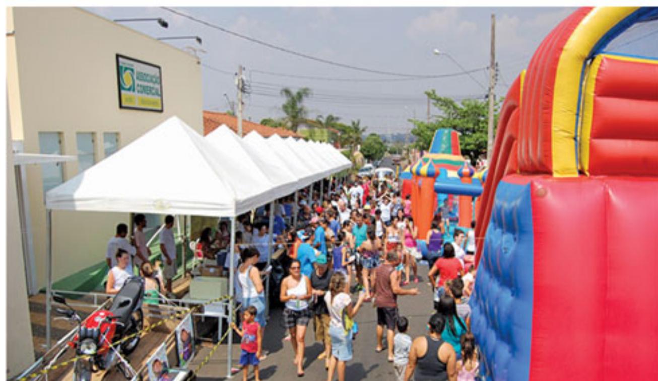
IX Ação Social realizada em 2014

Como de costume durante a ação social muito sorvete, cachorro-quente, suco, pipoca, algodão doce, pirulitos e muito mais serão distribuídos aos presentes, além de brinquedos para a diversão das crianças.