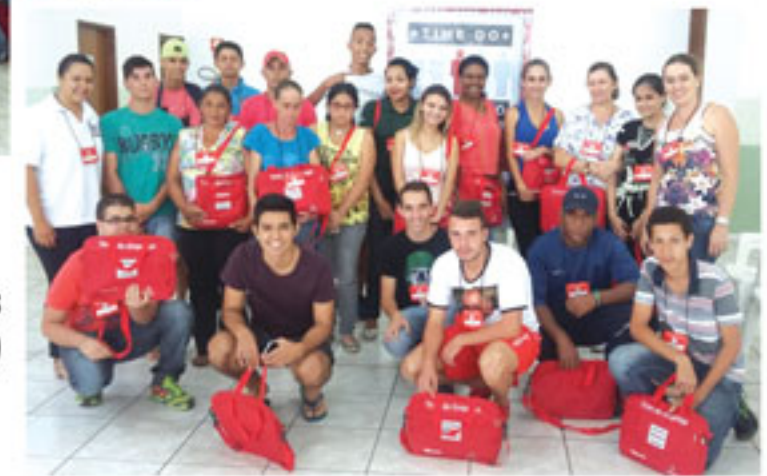
Time Os Vitoriosos (turma da tarde)