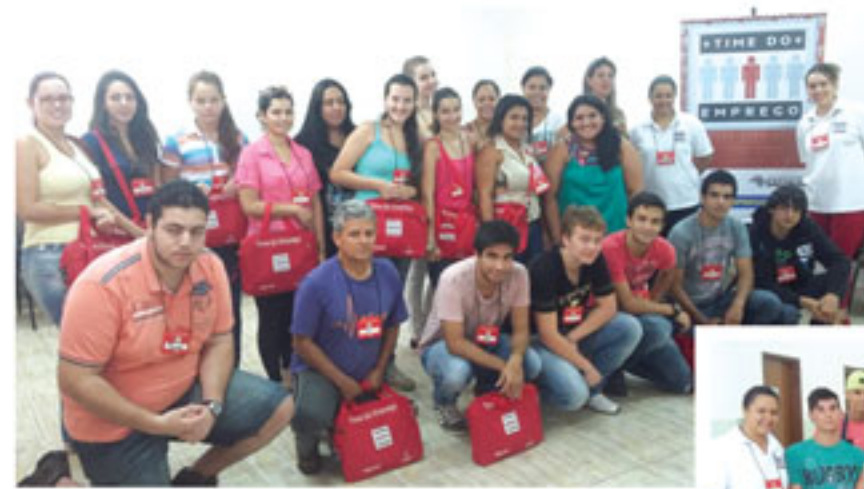
Time Dreamers (turma da manhã)

O público-alvo são trabalhadores desempregados maior de 16 anos e jovens em busca do primeiro emprego. É um programa que tem como objetivo orientar e preparar o trabalhador na busca de um emprego, compatível com seus interesses, habilidades e qualificação profissional.