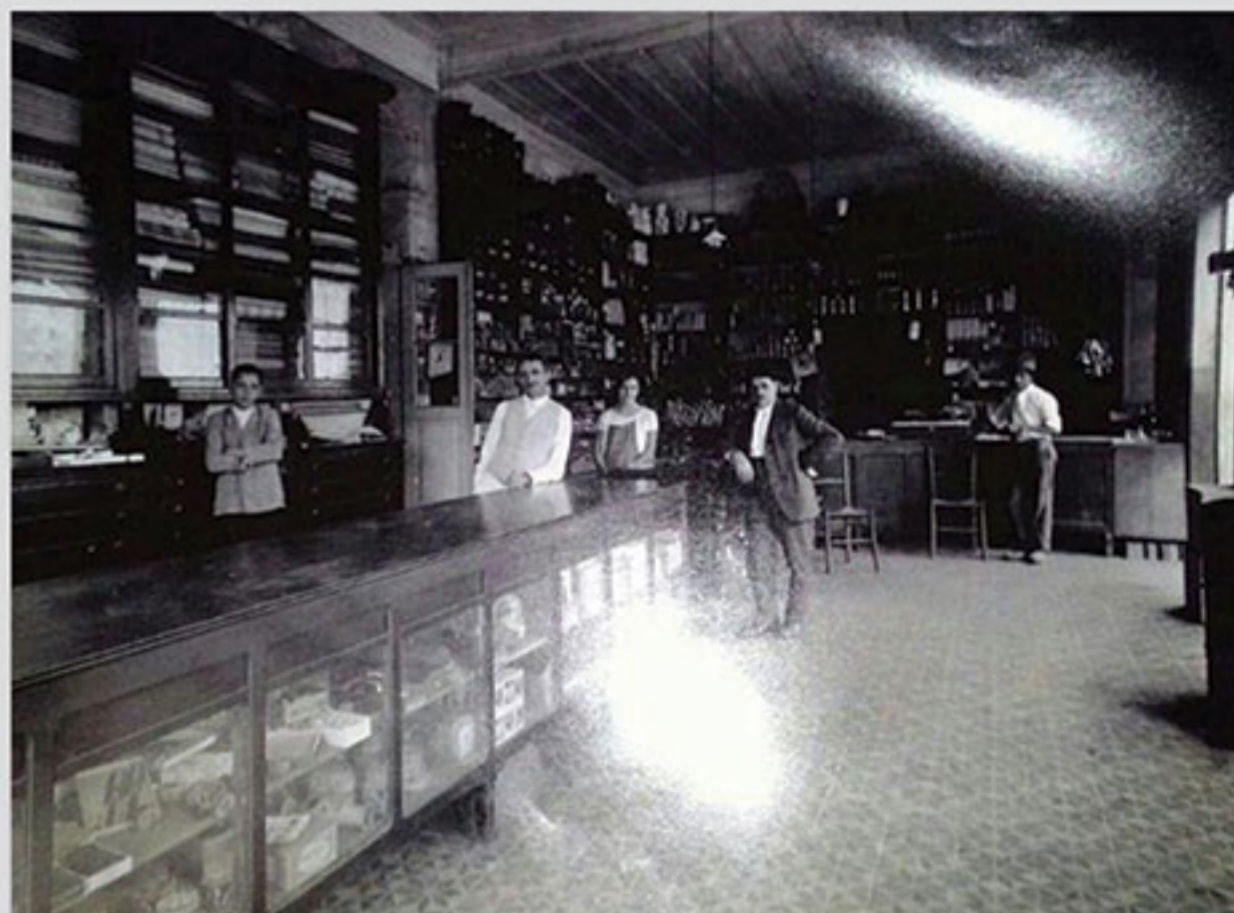
Casa Pinca (Década de 30) - Armazinho de secos e molhados - Avenida Coronel Rafael Tobias altura do número 150.