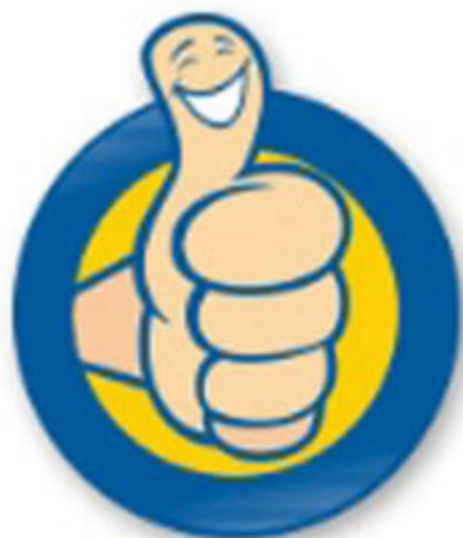
Campanha "Acertando suas contas", da Boa Vista Serviços.

Consumidores com dívidas em atraso podem usar a internet para renegociar com os credores.